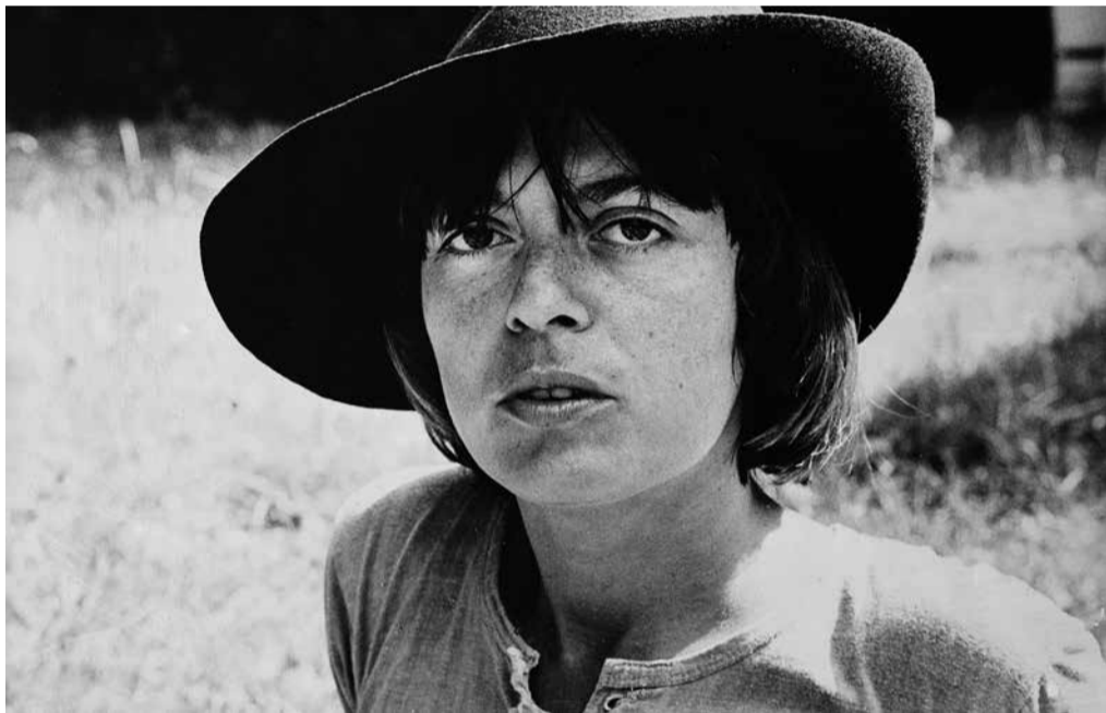
Monique Wittig en 1971. Figure éminente du Mouvement de libération des femmes (MLF), elle a choisi de s'installer aux Etats-Unis après des dissensions avec ses camarades de lutte.

Elle est entrée en littérature à 29 ans et a été couronnée du Prix Médicis en 1964 pour son premier roman. Monique Wittig, née en 1935 à Dannemarie, en Alsace, et décédée en 2003 à 67 ans à Tucson, aux Etats-Unis, est une figure du Mouvement de libération des femmes (MLF). Militante féministe lesbienne, elle s'exile aux Etats-Unis après des tensions avec ses camarades de lutte, ne trouvant plus sa place au sein du mouvement féministe français. Aux Etats-Unis, elle est invitée comme théoricienne dans les grandes universités, tandis qu'elle est petit oubliée dans l'Hexagone.